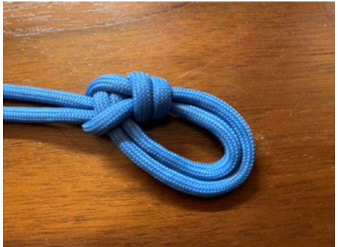
Dessus (il a l'aspect du nœud de chaise double).